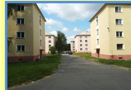
ulice U Svobodáren

Pro více fotek z míst, kde můžete terénní sociální pracovníky najít, se podívejte na náš Facebook.