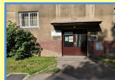
Kancelář terénního programu