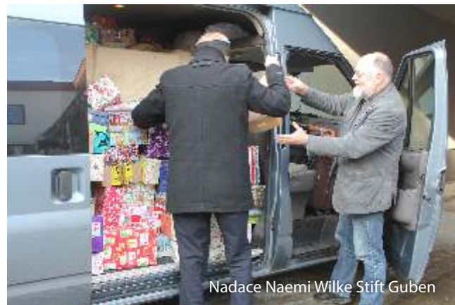
Nadace Naemi Wilke Stift Guben

V oblasti vzdělávání v křesťanské sociální práci jsme se v roce 2008 stali jednou ze zakládajících členů organizace INTERDIAC – Mezinárodní akademie pro diakonii a sociální akci , která se věnuje profesnímu rozvoji pracovníků v sociální oblasti ve střední a východní Evropě.