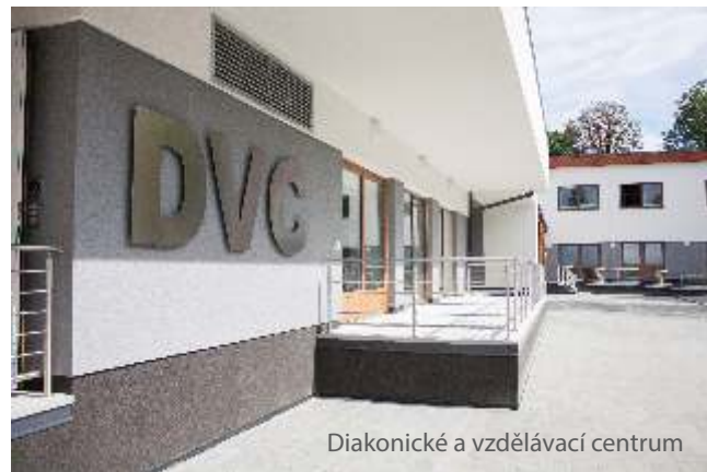
Diakonické a vzdělávací centrum

Za posledních 15 let jsme s podporou evropských zdrojů zrealizovali řadu investičních akcí jako jsou rekonstrukce budov a zajištění jejich bezbariérovosti, výstavba nových objektů nebo pořízení zařízení, vybavení, kompenzačních pomůcek či automobilů. Mezi nejvýznamnější projekty se řadí např. výstavba Diakonického a vzdělávacího centra v Českém Těšíně, nástavba budovy pro zřízení specializované pobytové služby pro osoby s poruchami paměti v Ostravě nebo celkové rekonstrukce objektů pro pobytové a ambulantní služby pro osoby se zdravotním postižením s cílem zajištění bezbariérovosti.