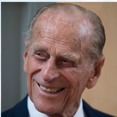
Jeho královská Výsost princ Philip, vévoda z Edinburghu

Program DofE založila roku 1956 Jeho královská Výsost, princ Philip, vévoda z Edinburghu, manžel britské královny Alžběty II. Proto název Mezinárodní cena vévody z Edinburghu (The Duke of Edinburgh's Award). S ním se na tvorbě programu podílel i Kurt Hahn, německý pedagog prosazující zážitkovou výuku, a lord Hunt, který mimo jiné vedl první úspěšnou expedici na vrchol Everestu. V Česku program funguje již od roku 1995. Mezinárodní cena vévody z Edinburghu je celosvětový program, který funguje ve více než 130 zemích.