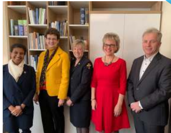
zahraniční návštěva z LCMS

We maintained our partnership with the American organisation from the Synod of Missouri. 2 conferences under the guidance of an American psychologist took place. The topics were focused on communication, how to communicate in difficult situations or how to motivate someone correctly. We also talked about synchronising our personal and professional life. Thanks to our German partners from the Naemi Wilke Foundation from Guben, a Christmas event was organised where clients of Slezská diakonie who lived in a difficult life situation received presents. We further deepened cooperation with other international organisations.