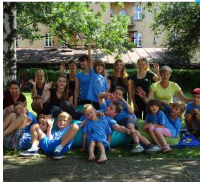
prázdninový pozdrav z terapeutického týdne v LYDII Český Těšín