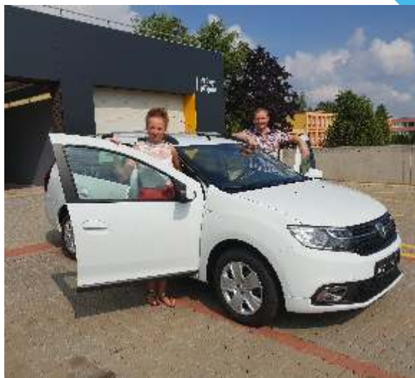
díky novému autu je vám ELIM Ostrava zase o něco blíž