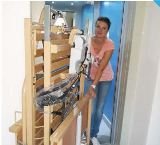
plné ruce práce aneb s úsměvem na cestě za novým pečujícím