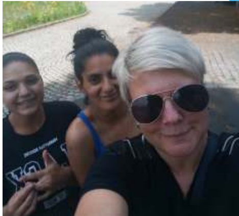
holky a teď "sýr"

Slezská diakonie, středisko TIMOTEI Bruntál za finanční podpory Moravskoslezského kraje a Nadace Komerční banky Jistota realizuje projekt: „Zkus to sám už teď“. Projekt je určen mladým lidem, kteří žijí v dětských domovech a výchovných ústavech v našem kraji. Pracovníci projektu navštěvují klienty s nabídkou skupinových programů zaměřených na rozvoj finanční gramotnosti, orientaci ve veřejných institucích, možnosti dalšího vzdělávání, profesní uplatnění a trh práce. Dále pak na rozvoj osobnosti a sebevědomí účastníků projektu. Mladí lidé na prahu dospělosti tak získají teoretické dovednosti, které si pak mohou prakticky vyzkoušet při zkušebním pobytu v prostorách střediska. Zde mají k dispozici plně vybavený byt a mohou si vyzkoušet samostatné hospodaření s penězi, vaření a úklid. Vyzkouší vyplnění formulářů na úřady, sestaví si životopis a na konci pobytu obdrží praktickou brožurku s informacemi určenými speciálně pro jejich životní situaci po opuštění dětského domova či výchovného ústavu. Jsou pro ně připraveny schůzky s odborníky z úřadu práce, Městského úřadu v Bruntále nebo Dluhové poradny HELP-IN o.p.s, za jejichž spolupráci děkujeme.