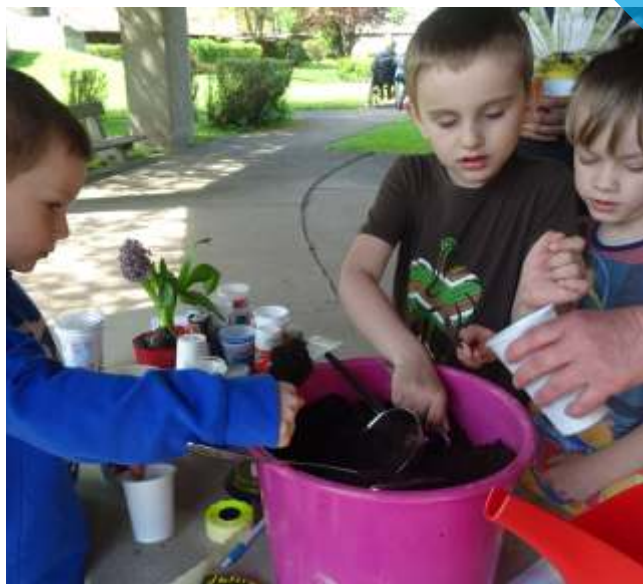
malí zahradníci - činnosti v rámci terapie O.T.A.