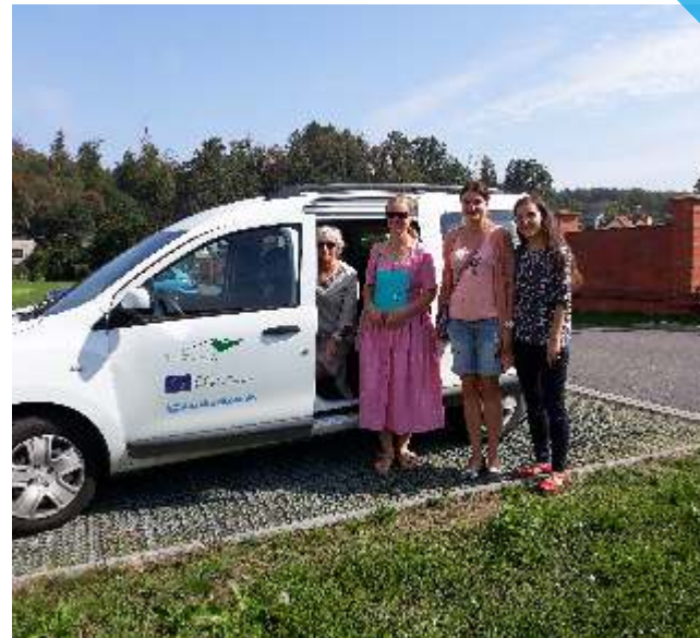
další potřebný pečující, další výjezd...