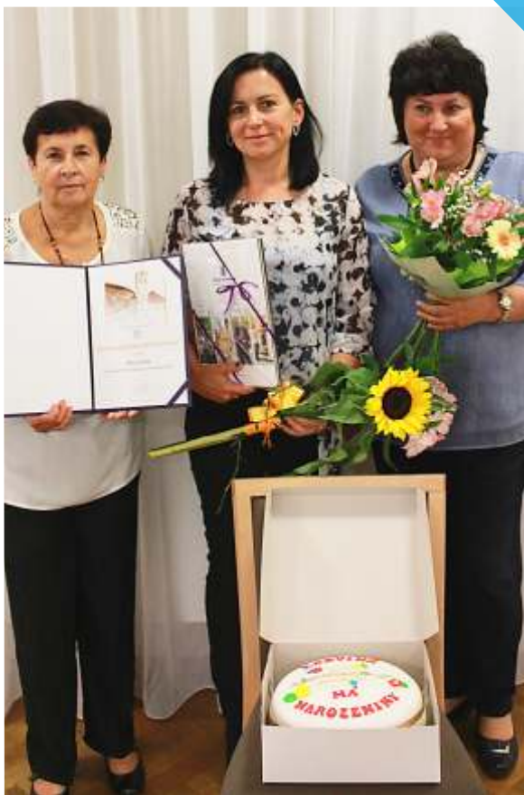
ocenění dobrovolnice střediska POHODA za dlouholetou práci