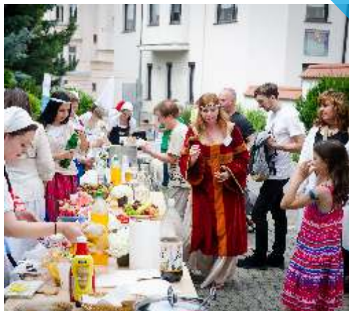
zahradní slavnost Pohádkový středověk