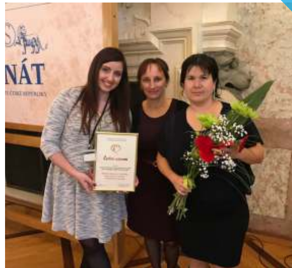
SILOE v Praze vyhodnoceno bylo, za kvalitní poskytování služeb čestné uznání převzalo