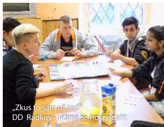
„Zkus to sám už teď“ DD Radkov - učíme se hospodařit