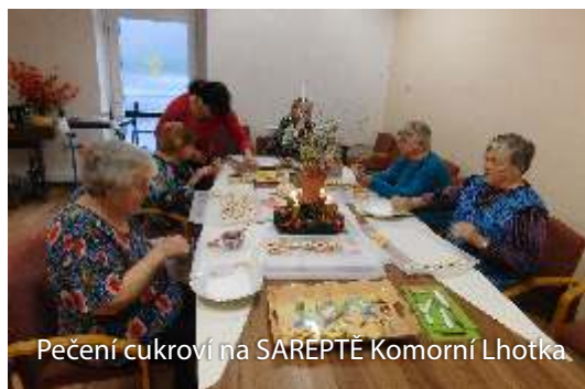
Pečení cukroví na SAREPTĚ Komorní Lhotka