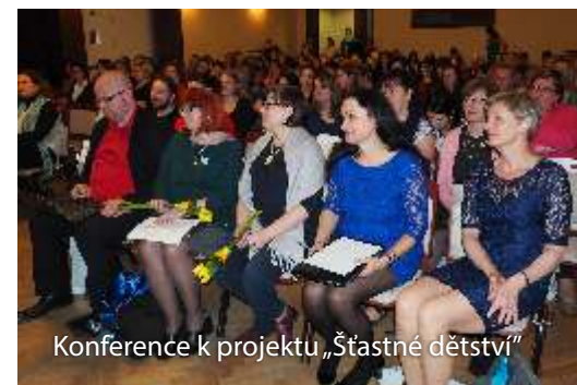
Konference k projektu „Šťastné dětství“