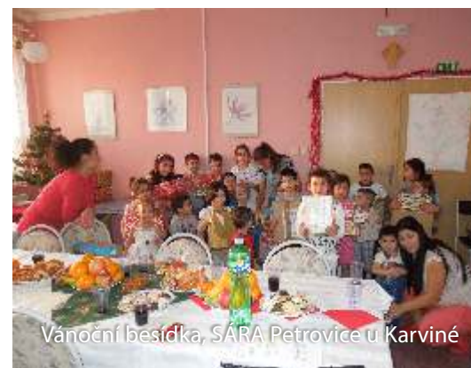
Vánoční besídka, SÁRA Petrovice u Karviné