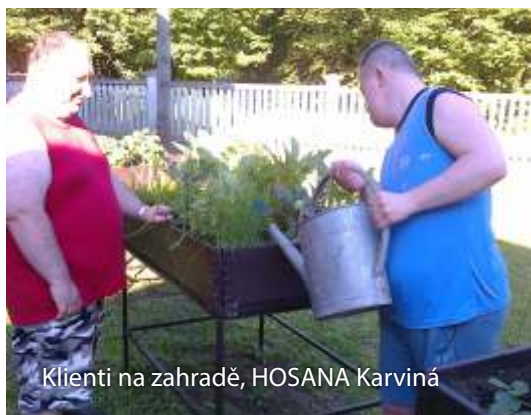
Klíenti na zahradě, HOSANA Karviná