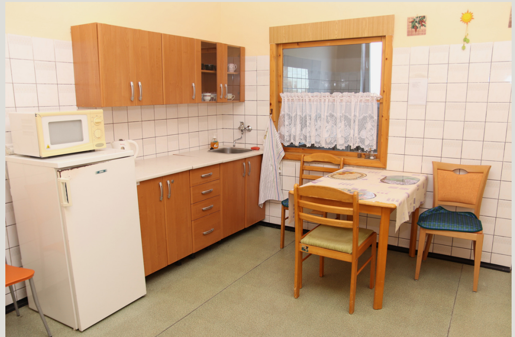
Kuchyňka ve 2. patře