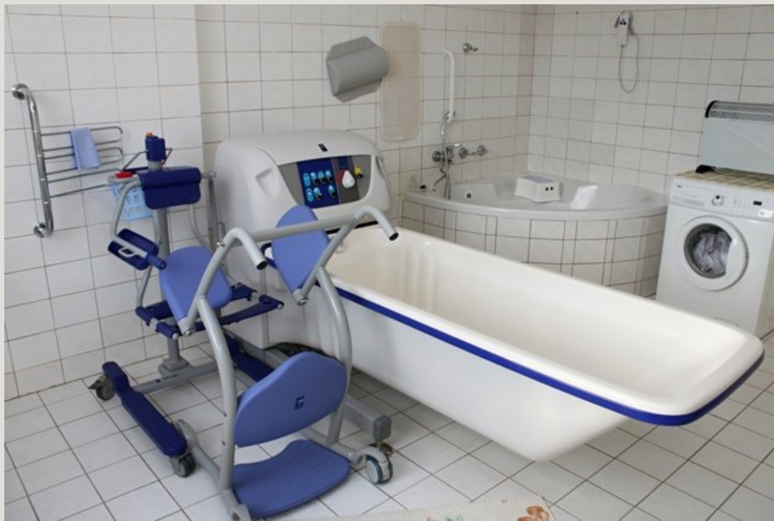
Společná koupelna na patrech