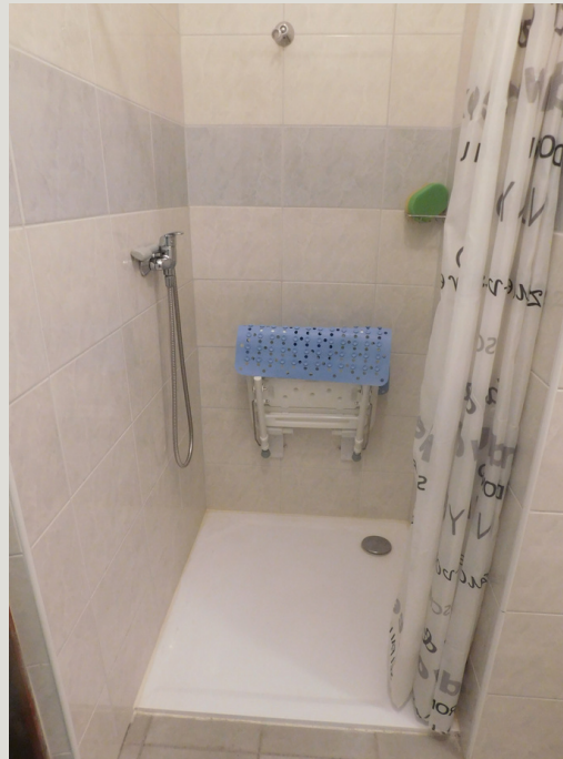
Sprchový kout a WC kabina na pokojích