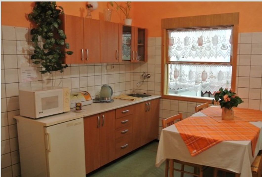
Kuchyňka v 1. patře