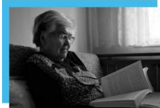
Fotografie jsou pořízeny ve středisku ELIM Ostrava.