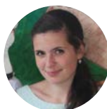
rozhovor vedla Kateřina Rusnoková

http://www1.osu.cz/~novotny/kazani/ www.noach.cz www.adash.osu.cz