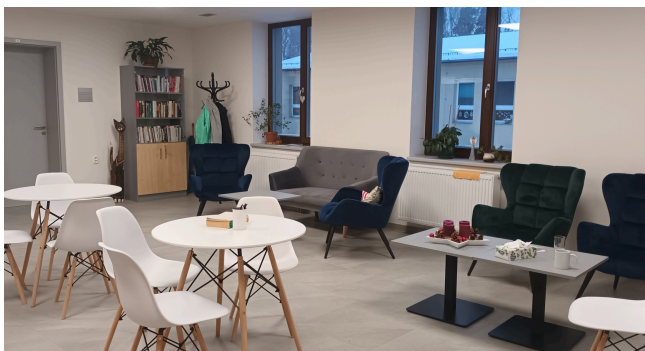
Aktivity s psychoterapeutem